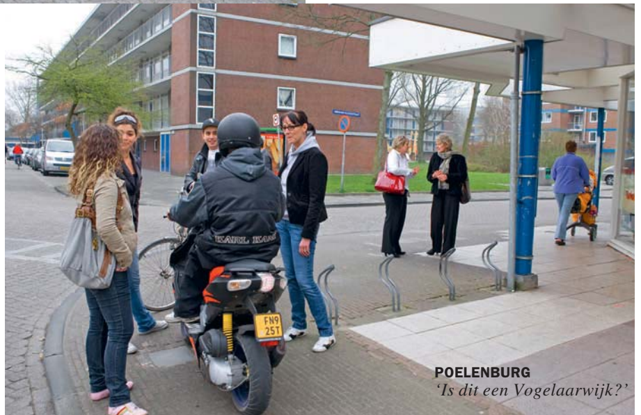
POELENBURG 'Is dit een Vogelaarwijk?'

Het kabinet-Balkenende IV kwam in het regeerakkoord van februari 2007 met een 'actieplan' om de veertig 'kwetsbaarste probleemwijken' om te toveren tot 'prachtwijken'. Speciaal daarvoor werd een ministerie in het leven geroepen dat niet