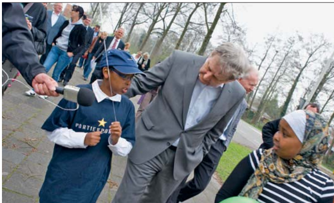
MINISTER EBERHARD VAN DER LAAN bezoekt wekelijks een van de veertig probleemwijken.